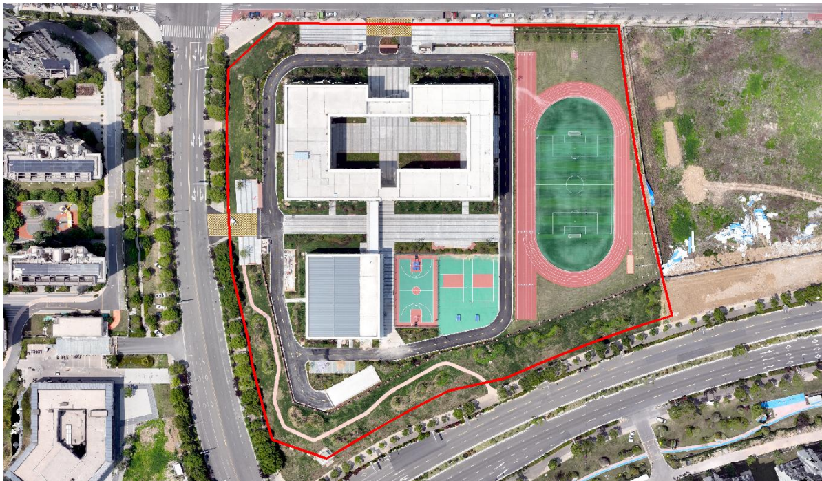
项目区排水、绿化照片及整体航拍（2025年5月）