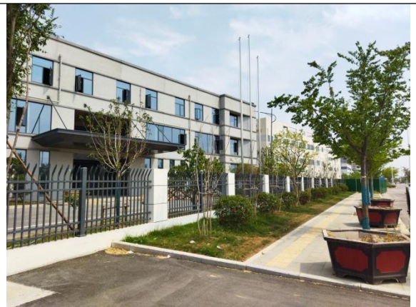
围墙退红线区域绿化 (2025.5)