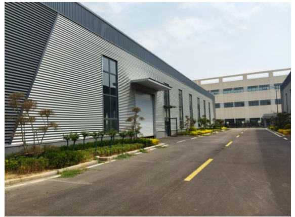
内部道路及周边绿化 (2025.5)