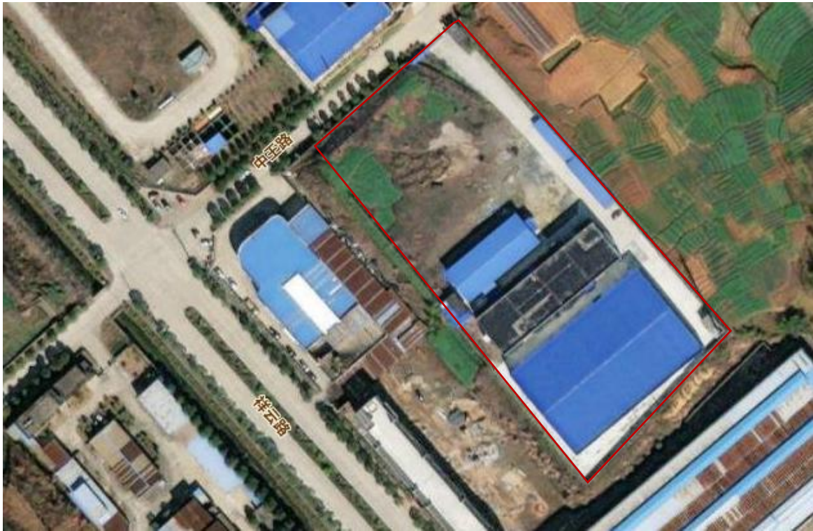
图 1.4-1 项目正射影像图（原始地形）