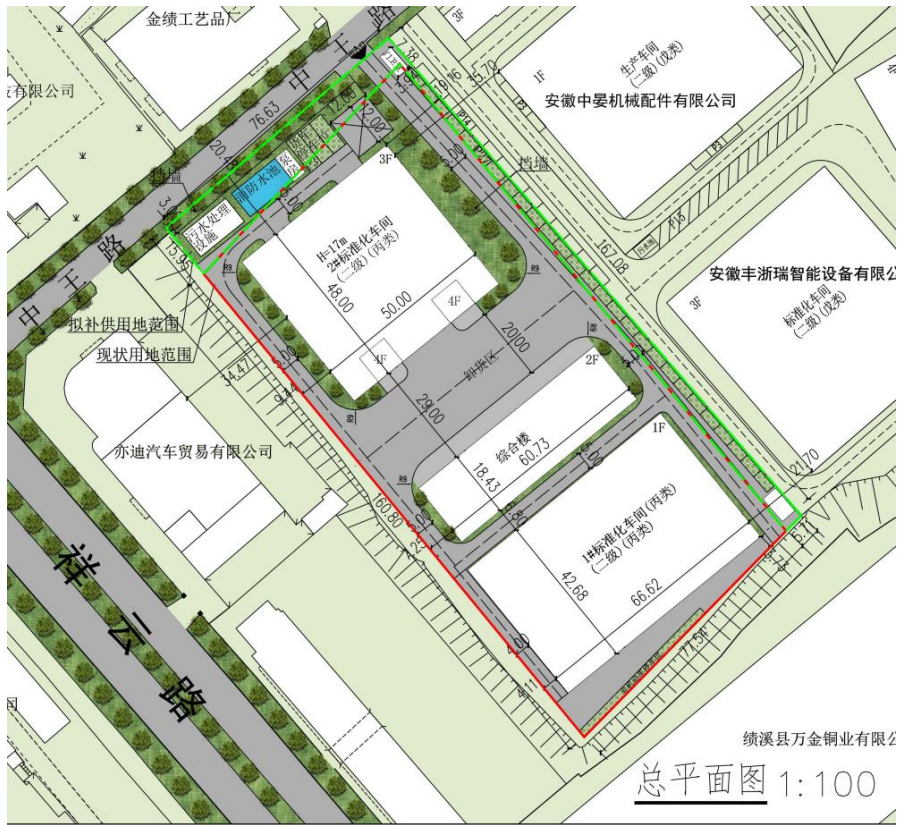
图 1.2-2 项目总平面布置图