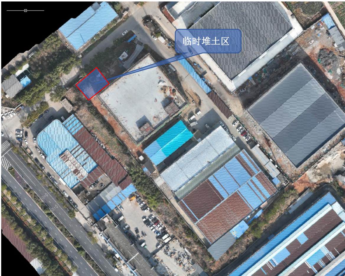
图 1.3-2 临时堆土区位置图