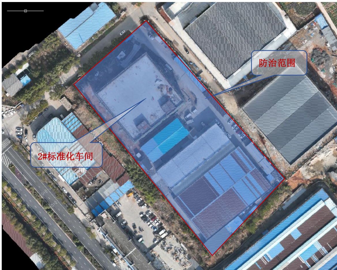
图 1.1-1 项目现场航拍图