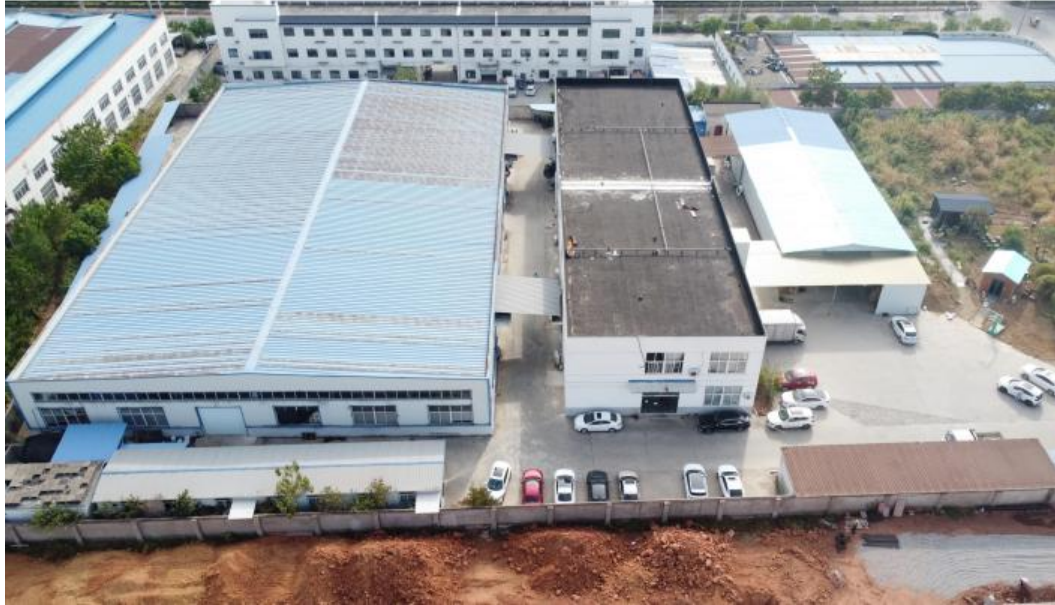
图 1.2-1 已建 1#标准化车间和综合楼航拍图